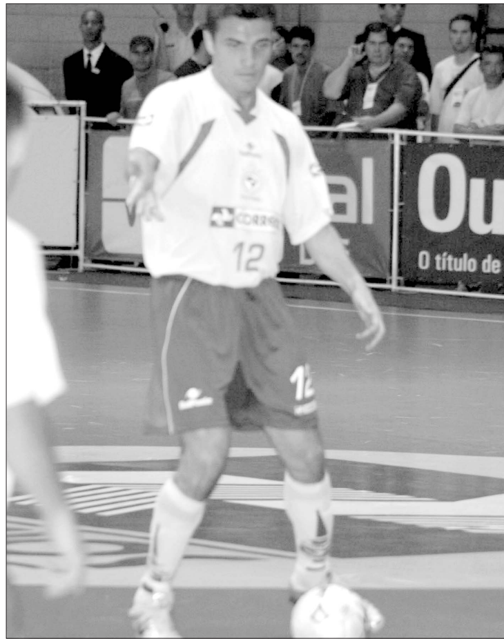
FALCÃO- Melhor jogador de futsal do mundo, presença certa em todas as convocações da Seleção Brasileira de Futsal